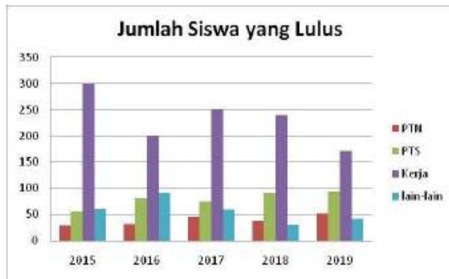
(Grafik Data pada Tabel 2. Data Lulusan dan Sebarannya Tahun 2016-2020)

Dari grafik diatas dapat disimpulkan bahwa lulusan MAN 1 Grobogan mulai tahun 2015 s.d 2019 sebaran siswa sebagian besar tidak melanjutkan ke perguruan tinggi.